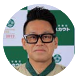
宮川 大輔 タレント