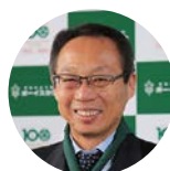
岡田 武史 FC今治オーナー 元 サッカー日本代表監督