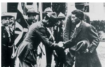
1921年、イギリスのボーイスカウトの大集会における昭和天皇(当時、皇太子)