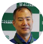
野口 聡一 JAXA宇宙飛行士

大和ハウス工業株式会社より寄贈を受け、2017年にグランドオープンした約82万坪の広大な野営場。指導者訓練のほか、地域社会と共生する施設として各種事業を展開。