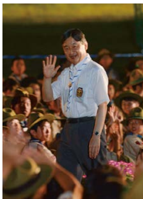
2018年、第17回日本スカウトジャンボリーにご来臨。第7回大会より欠かさずお越しになられ、スカウトにおことばを賜ってきました。