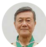
大坪 文雄 パナソニック株式会社特別顧問