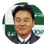
清宮 克幸 日本ラグビーフットボール協会副会長