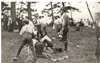
歴史的な実験キャンプ 1907年、創始者ロバート・ベーデン-パウエル卿がイギリスのブラウンシー島に20人の少年たちを集めて実験キャンプを行いました。これがボーイスカウト運動の始まりです。