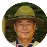
水野 正人 ミズノ株式会社相談役会長