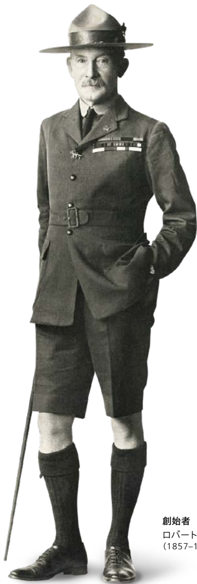
創始者 ロバート・ベーデン-パウエル卿 (1857-1941)